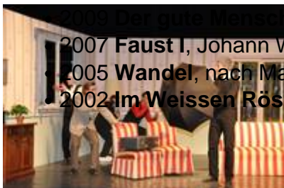
Lord Arthurs Verbrechen